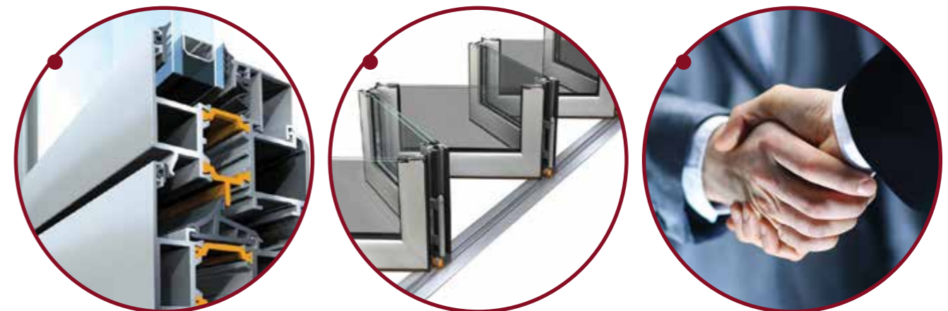
Aufbau von Handelsbeziehungen